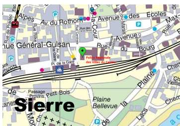
Sierre, Rue du Bourg 12

Les guichets sont ouverts du lundi au vendredi de 08h00 à 12h00 et de 13h30 à 17h00