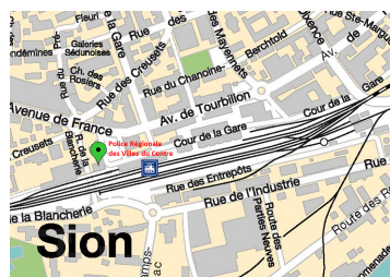
Sion, Place de la Gare 11