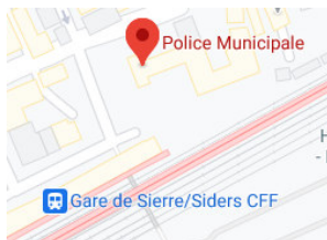
Sierre, Rue du Bourg 12

Les guichets sont ouverts du lundi au vendredi de 08h00 à 12h00 et de 13h30 à 17h00